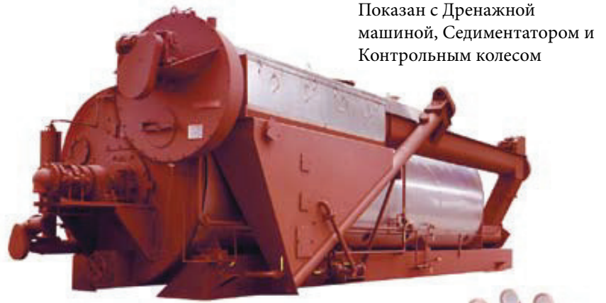
Показан с Дренажной машиной, Седиментатором и Контрольным колесом

До 4400 квадратных футов поверхности теплопередачи.