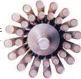
Вал трубчатого типа (вид с конца).